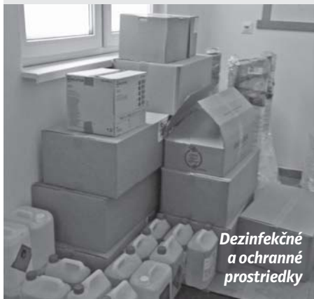
Dezinfekčné a ochranné prostriedky

„Realizované s finančnou podporou Ministerstva investícií, regionálneho rozvoja a informatizácie Slovenskej republiky - program Podpora regionálneho rozvoja“