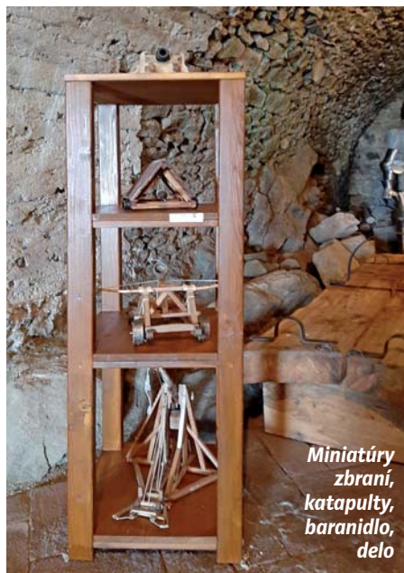
Miniatúry zbraní, katapulty, baranidlo, delo

odievania, stravovania. Zároveň rozvíja aj umelecké schopnosti ako divadlo či žonglovanie. Pre potreby zabezpečenia čo najautentickejšej zbroje a zbraní pre SARUS, dokáže vytvoriť všetko, čo nám môže priblížiť spôsob života na stredovekom hrade.