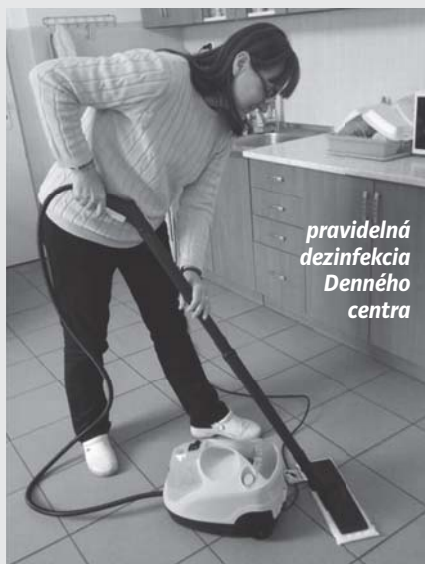
pravidelná dezinfekcia Denného centra

mestie sv. Martina a na NKP hrad Kapušany ako opatrenie na zvýšenie hygienických štandardov na miestach, kde nie je možné použiť tečúcu vodu.