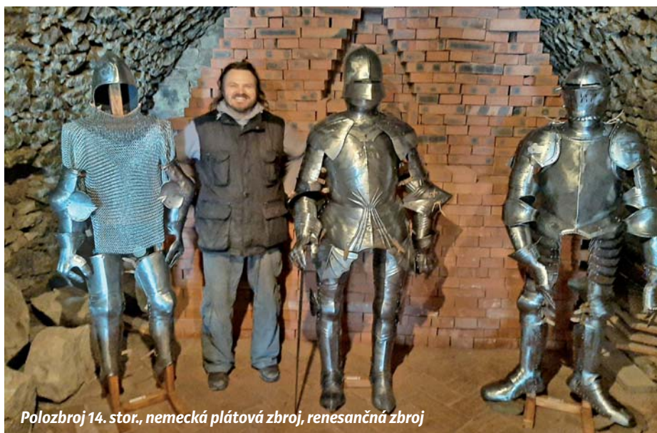
Polozbroj 14. stor., nemecká plátová zbroj, renesančná zbroj

šermiarov SARUS. Záleží mu na kvalite a historickej presnosti. Preto sa neustále vzdeláva v odbore bojových umení a dejín