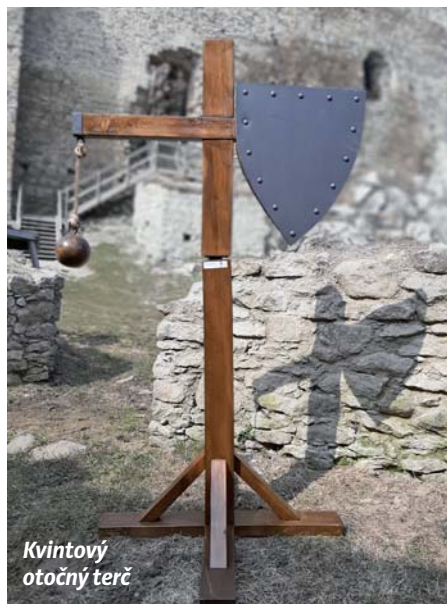
Kvintový otočný terč