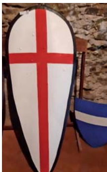
Mandľový štít a rytiersky štít