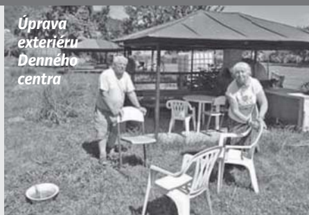
Úprava exteriéru Denného centra

Obci Kapušany bola Ministerstvom investícií, regionálneho rozvoja a informatizácie Slovenskej republiky poskytnutá dotácia v sume 18 036 € na projekt Zmiernenie dopadov koronakrízy. Prostriedky čiastočne pokryli mzdy dvoch pracovníčok v Dennom centre, ktoré zabezpečovali komunitné aktivity zamerané na skupiny obyvateľstva najviac poznačené krízou. V rámci projektu boli zakúpené potreby na realizáciu komunitných a vzdelávacích aktivít pre tieto ohrozené skupiny, dezinfekčné a ochranné prostriedky. Ďalšou aktivitou bolo zakúpenie 5 ks mobilných dezinfekčných stojanov, ktoré sú určené do Denného centra, na verejné priestranstvá - Park svätých Cyrila a Metoda, Ná-