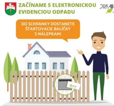
VIAC INFORMÁCIÍ NÁJDETE NA www.menejodpadu.sk/elwis ,