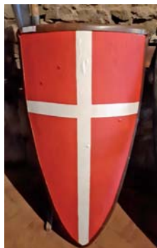
Rytiersky štít 13. - 14. stor.