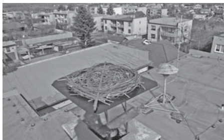
Príprava na nové hniezdo

prípadným stratám. Hniezdo na komíne obecného úradu v Kapušanoch je monitorované od roku 2000. Hniezdo je každoročne obsadené a za ten čas z hniezda do sveta vyletelo 46 mláďat. Hniezdo pred pár rokmi bolo odľahčené od hniezdneho materiálu a v týchto dňoch bolo staré hniezdo zhodené a pripevnená nová hniezdna podložka. Tá by mala zabrániť vypadávaniu hniezdneho materiálu a tým znečisťovaniu okolia budovy obecného úradu.