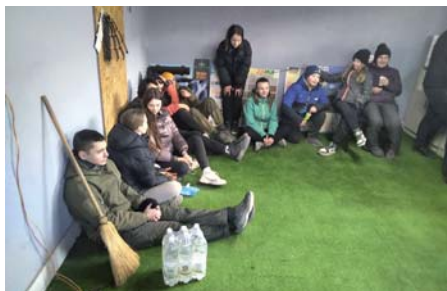
Ukrajinská mládež krátko oddychuje pred ďalšou dobrovoľníckou aktivitou

Prvé týždne som mal obavu, či to všetci zvládneme. Bolo to naozaj ťažké a situácia za hranicou je neporovnateľne ťažšia ako u nás, kde nám utečenci prichádzajú. Všetko je však otázka vnútorného nastavenia, energie a dobrého manažmentu. To všetko asi máme. Nastavili sme procesy, veľa vecí sa ujasnilo a utriaslo a teraz je napriek stále vážnej situácii relatívny pokoj, zvládame to. Ani Slovenský, ani Ukrajinský, ani iný štát alebo „spasiteľská organizácia“ nám nijako nepomohli (teraz myslím na ukrajinskú stranu, lebo na našej strane SR pomáha myslím vcelku dobre). Tí, ktorí najviac pomohli, boli obyčajní občania SR i UA, slovenské firmy, niektoré organizácie. A myslím, že najviac pomohli naše slovenské obce. Starostovia zareagovali veľmi dobre. Tým, že sú niektorí z nich dobrí manažéri a rozumejú krízovým situáciám, dokázali urobiť neuveriteľný kus práce pre ukrajinské obce a mestá. Od zbierok potrebného materiálu a potravín, cez logistiku, až po finančné zdroje.