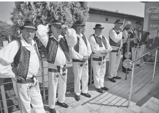
Privítanie komisie súťaže Dedina roka

Ďalšie naše vystúpenie bolo v rekreačnej oblasti Domaša, kde s našimi seniormi pri atraktívnej plavbe loďou, posedeniu pri káve, sme našim seniorom pripravili pekný zážitok piesňami.