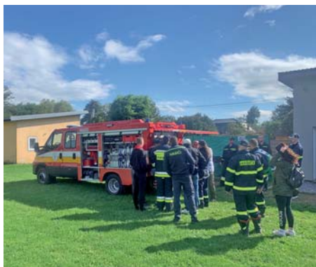
Školenie obsluhy vozidla IVECO Daily CAS 15

pri požiaroch, technických výjazdoch alebo iných udalostiach.