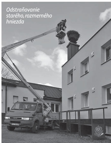
Odstraňovanie starého, rozmerného hniezda

Koniec marca je obdobím, kedy sa bociany vracajú do svojich domov, aby zahniezdili a priviedli na svet svojich potomkov. Pre ochranárov je to aj termín, kedy je nutné dokončiť všetky prekládky alebo úpravy hniezd, aby boli pripravené pre svojich nájomníkov. Bociany si po prílete hniezdo upravujú, donášajú nový materiál, aby bolo najlepším domovom pre ich ratolesti. Každoročným dopĺňaním materiálu ako aj odpadom, ktorý vznikne pri výchove potomstva hniezdo narastá do úctyhodných rozmerov. Môže dosahovať až 1,5 metra na výšku a váhu niekoľko stoviek kilogramov. V prípade rozmerného hniezda je potrebné pristúpiť k úprave, aby sme predišli jeho zrúteniu a v čase výchovy mláďat aj