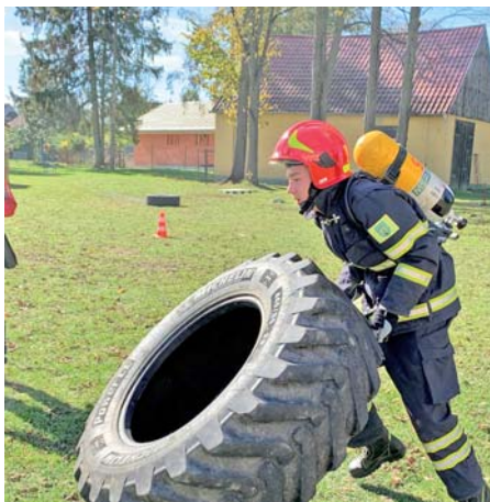
Súťaž „Železný hasič“, Poprad – Veľká

DHZO KAPUŠANY - Dobrovoľný hasičský zbor obce je hasičská jednotka, ktorú zriaďuje obec v zmysle ustanovenia § 33, odsek 1 zákona 314/2001 Z. z. o ochrane pred požiarmi, v znení neskorších predpisov. Každá obec s počtom obyvateľov nad 500 musí mať zriadenú hasičskú jednotku na plnenie úloh súvisiacich s likvidáciou požiarov a záchrannými prácami. Členovia DHZO