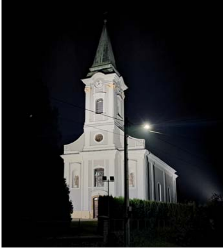
V rámci rekonštrukcie verejného osvetlenia bolo vymenené i nasvetlenie kostola sv. Martina moderným LED osvetlením.