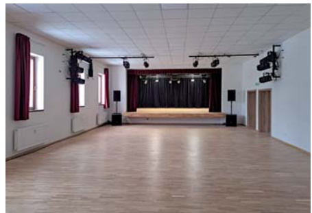
Spoločenská sála kultúrneho domu, vstupná chodba a šatne FS Kapušančan sú v novom šate.