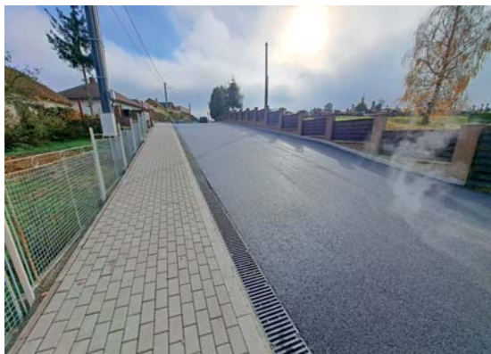
Rekonštrukcia časti miestnej komunikácie ul. Cintorínska je ukončená.