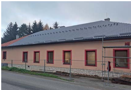
Prebiehajúca výmena strešnej krytiny na budove kultúrneho domu.