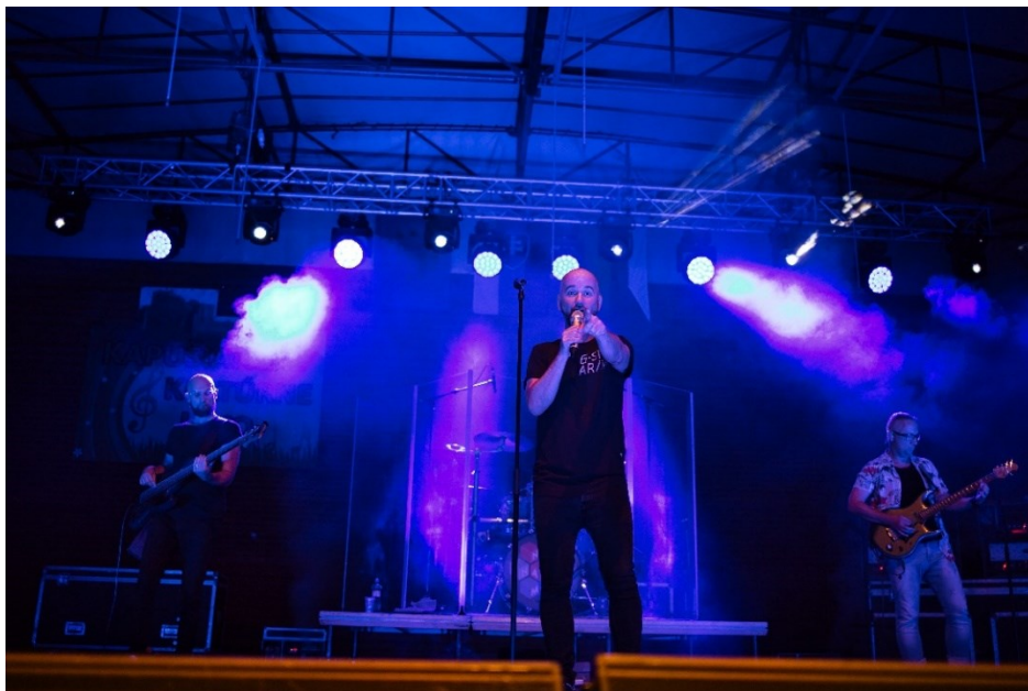
Skupina NO NAME

Dňa 23.7.2022 sa na obecnom ihrisku uskutočnilo 95. výročie futbalu, kde boli ocenené osobnosti futbalu.